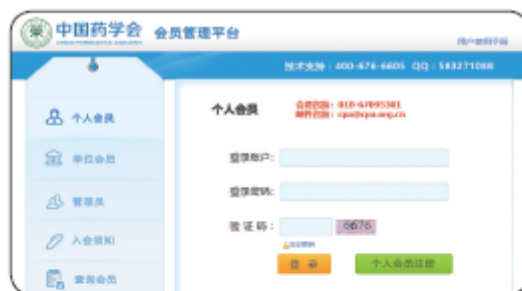
会员管理系统首页

▶备注: 基础信息中红色部分为必填项, 完善信息部分所有数据均为必填项, 没有请填写“无”