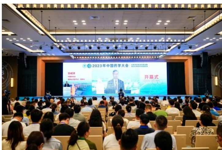
9月9日，江苏南京，2023年中国药学会大会

大会邀请3位领导、院士作主题报告，设置第十一届中国药学会生物技术药物质量分析研讨会、医院药学学科发展与创新药学服务研讨会、创新药价值挖掘与综合评价论坛等12个分会场，130余位各领域知名专家在分会场进行专题报告交流。