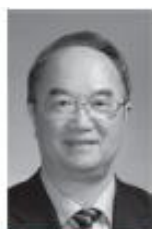
名誉理事长 桑国卫